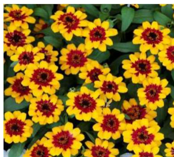
PROFUSION red yellow bicolour