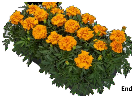
Endurance Orange - MAR602