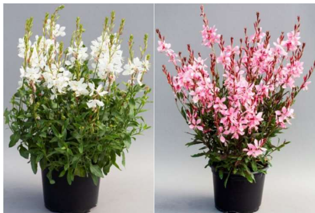
Emmeline White - GAU101