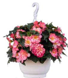
Rose picotée C88221P