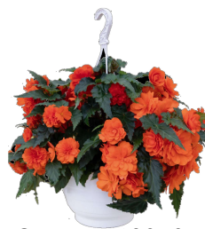
Orange - C8050P