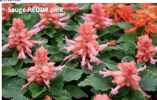
Sauge REDDY pink