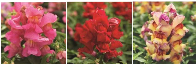
Pink - ANT622