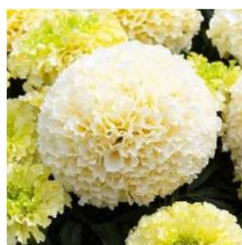
White Gold Mini MAR261