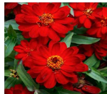
PROFUSION Double red