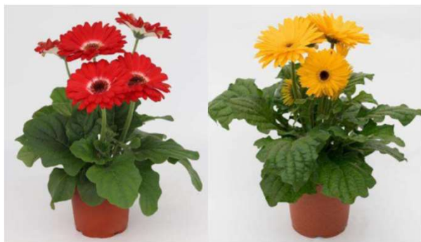
Red Bicolour Dark Eye