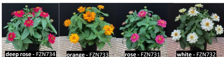
deep rose - FZN734 orange - FZN733 rose - FZN731 white - FZN732