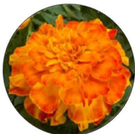
Endurance Sunset Gold - MAR603