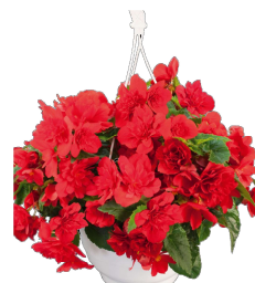
Red - C8210P