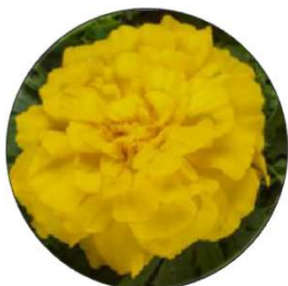
Endurance Yellow - MAR601