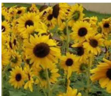
Dancing Sun - FHM414