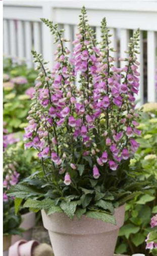
Digitale PANTHER - FDGA31