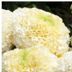
White Gold Maxi MAR262