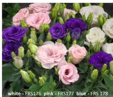
white - FRS176 pink - FRS177 blue - FRS 178