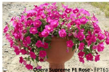
Opera Supreme F1 Rose - FPT618