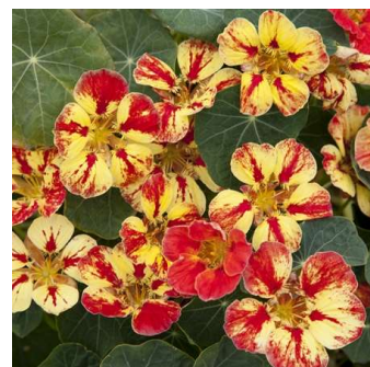
Ice Cream Sundae - VNA001